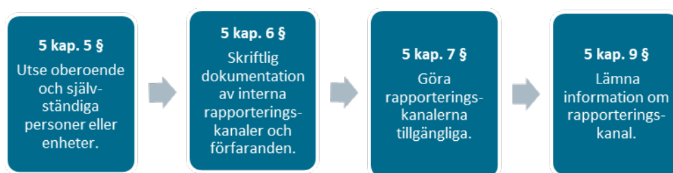
Figur 2. Stegen i visselblåsarlagen

Inledningsvis behöver myndigheterna genomföra åtgärder genom att utse personer, skriftligen dokumentera rapporteringskanalerna, göra kanalerna tillgängliga och lämna information om kanalerna. För dessa steg finns ingen reglerad tidsfrist.